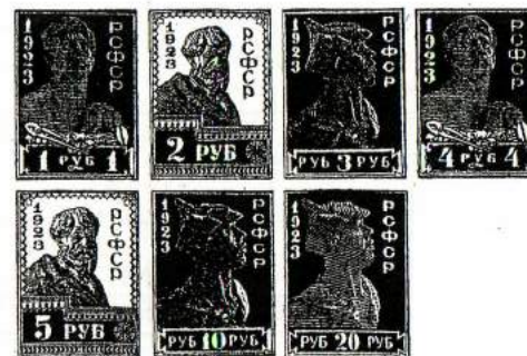
Série courante millésimée 1923 dentelée ou non.