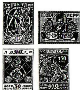
Timbres ukrainiens en karbovanetz (1karb=1k).

1 мая 1923 г. 1 мая 1923 г. Филателия — Трудящимся. 1 р. + 1 р. 2 р. + 2 р. 4 р. + 4 р. Филателия — Трудящимся. 1 мая 1923 г.