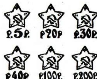
5, 20, 30, 40, 100, 200 roubles surcharges litho ou typo sur timbres dentelés ou non de 1909.