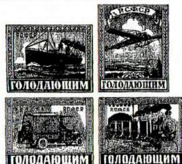
Au profit des victimes de la famine, vendus 25 roubles pour 20 roubles d'affranchissement.