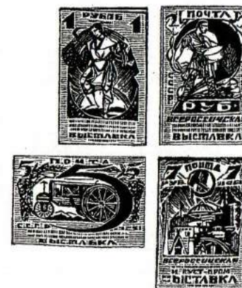
Exposition agricole et artisanale de Moscou.

Surcharge au profit des travailleurs indigents. TOUS TIMBRES EMIS EN ROUBLES 1923