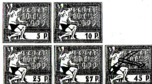
5 me anniversaire de la Révolution d'octobre