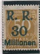
Surcharge R.R. 30 Millions de Marks Sur 500 000 Mks Ocre-brun (275b)