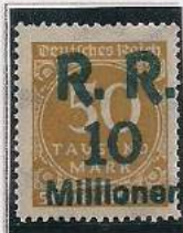
Surcharge R.R. 10 Millions de Marks Sur 500 000 Mks Ocre-brun (275b)

Les planches furent détruites sous surveillance de l'autorité de WIESBADEN le 9 janvier 1924.