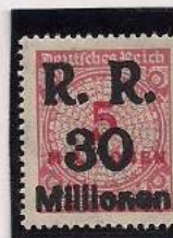
Surcharge R.R. 30 Millions de Marks Sur 5 Million Mks Carmin clair (317a)