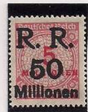
Surcharge R.R. 50 Millions de Marks Sur 5 Million Mks Carmin clair (317a)