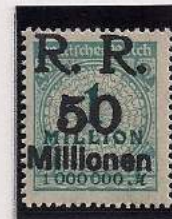
Surcharge R.R. 50 Millions de Marks Sur 1 Million Mks Bleu-vert (314a)