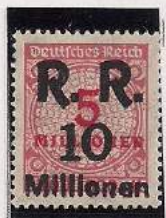
Surcharge R.R. 10 Millions de Marks Sur 5 Million Mks Carmin clair (317a)