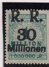
Surcharge R.R. 30 Millions de Marks Sur 1 Million Mks Bleu-vert (314a)