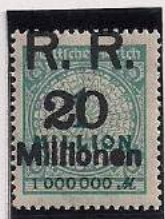
Surcharge R.R. 20 Millions de Marks Sur 1 Million Mks Bleu-vert (314a)