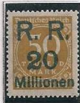
Surcharge R.R. 20 Millions de Marks Sur 500 000 Mks Ocre-brun (275b)