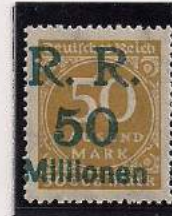
Surcharge R.R. 50 Millions de Marks Sur 500 000 Mks Ocre-brun (275b)