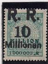
Surcharge R.R. 10 Millions de Marks Sur 1 Million Mks Bleu-vert (314a)