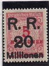
Surcharge R.R. 20 Millions de Marks Sur 5 Million Mks Carmin clair (317a)