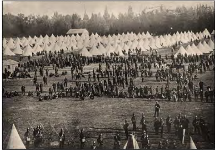
Camp de toile des prisonniers français près de Posen

Le nombre de prisonniers français en Allemagne est estimé à plus de 360 000 soldats et 10 000 officiers, dont la majorité a été capturée lors des redditions de Sedan et de Metz. Le nombre de camps d'internements est lui estimé à plus de 300, principalement en Prusse à distance du « front de combat ».