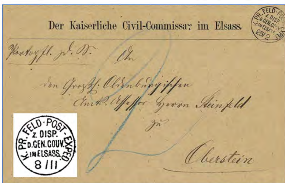
Lettre du commissariat civil de l'Alsace du 25 février 1871 avec timbre à date du bureau postal militaire mis à la disposition du gouvernement général de l'Alsace.