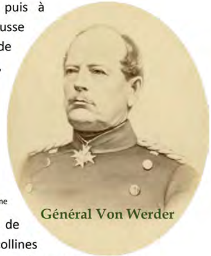
Général Von Werder

Après les défaites françaises à Wissembourg le 4 août, puis à Froeschwiller-Woerth le 6 août, le prince héritier Frédéric de Prusse ordonne au général August Von Werder de mener son armée de 40 000 hommes de Bade et de Prusse à Strasbourg. À l'époque, Strasbourg était considérée comme une des places fortes les mieux défendues de France. Mais les 17 000 français, commandés par le général Jean-Jacques Alexis Uhrich (né à Phalsbourg en 1802), ne purent résister aux allemands et leurs armements modernes.