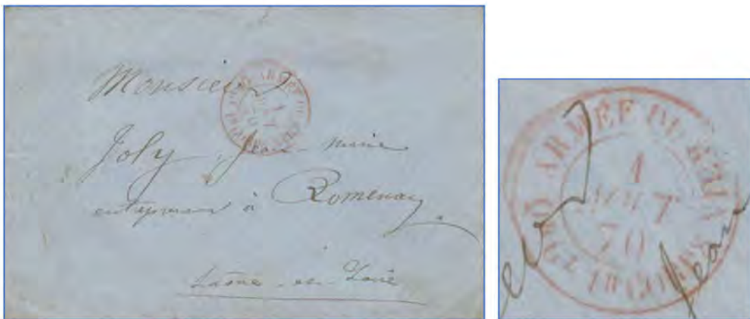
Lettre du 1 er août 1870, expédiée depuis le quartier général du 1 er corps d'armée installé à Strasbourg du 25 juillet au 4 août 1870

La 2 ème division de ce premier corps ira se déployer le soir du 3 août à Wissembourg et sur les hauteurs du Geisberg avec mission de surveillance. L'armée française est très mal renseignée sur l'importance des forces allemandes du secteur. Les 6 000 hommes de la 2 ème division devront résister à 30 000 soldats prussiens et bavares.