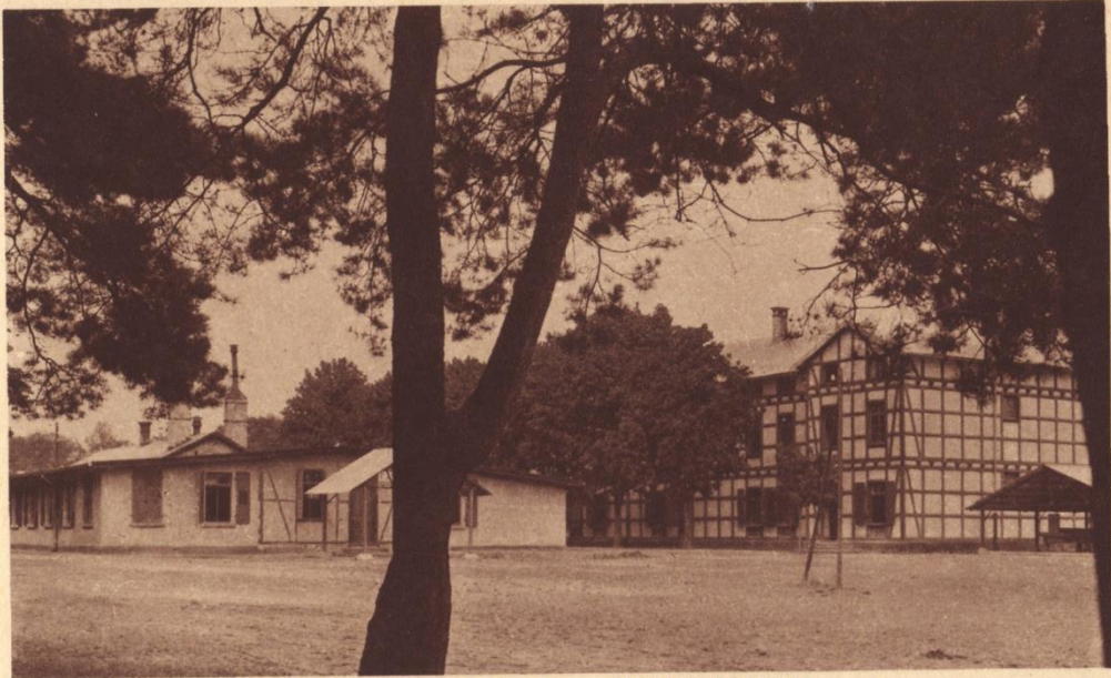
2362 c CAMP D'OVERHOFFEN — BATIMENTS DE TROUPE