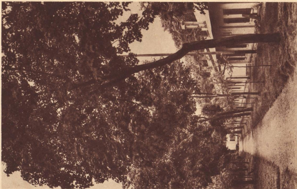
1560 c CAMP D'OVERHOFFEN — CASERNEMENTS SOUS LA VERDURE