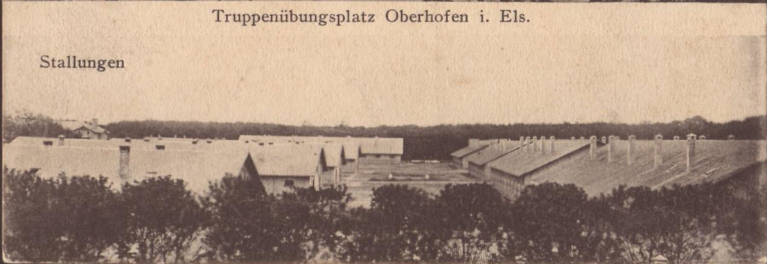
Truppenübungsplatz Oberhofen i. Els.