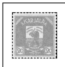
20 p. rose