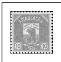
10 p. bleu clair