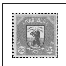
20 m. rose et vert