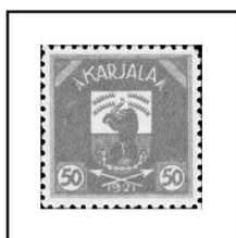
50 p. olive