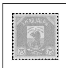
75 p. jaune