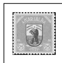
25 m. jaune et bleu