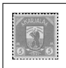
5 m. rose-lilas et gris