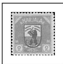
2 m. olive et gris