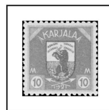
10 m. brun clair et gris