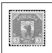
3 m. bleu clair et gris