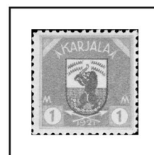
1 m. rose et gris