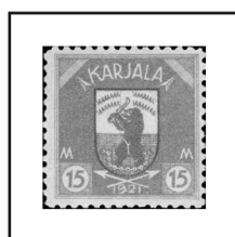
15 m. olive et rouge