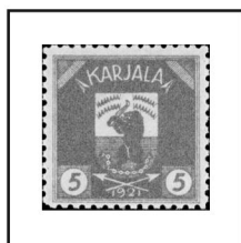
5 p. gris

1922 - Timbre d'usage courant, avec l'ours représentant le blason de l'état. Dentelés 11¼ ou 11¾.