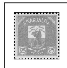
25 p. brun clair