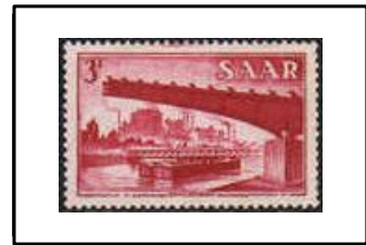
Pont de Gersweiler et hauts fourneaux de Burbach.