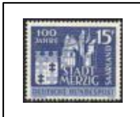
Centre de la ville de Merzig.