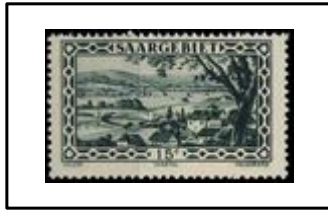
Vallée de Gudingen