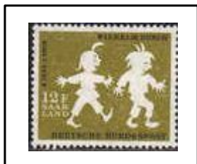
Max et Moritz.

50e anniversaire de la mort du dessinateur humoristique allemand Wilhelm Busch.