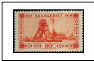
Puits de mine