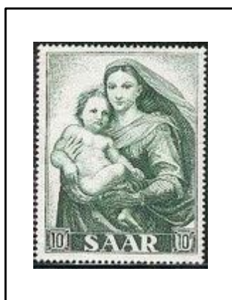
Madone Sixtine, par Raphaël.