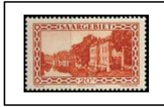
Caserne Vauban à Sarrelouis