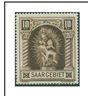
1926. - Au profit des œuvres populaires.