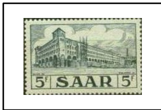
Poste centrale de Saarbruck.