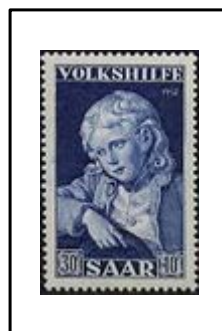
Portrait de garçon, par G-M Kraus