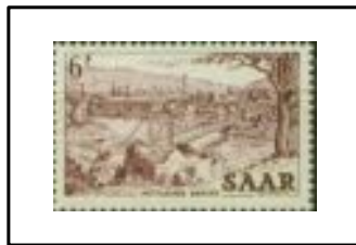
Pont suspendu de Mettlach et usine Villeroy et Boch.