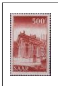
Eglise Saint-Louis de Saarbruck.

1953.Avec inscription "INDUSTRIE-LANDSCHAFT"