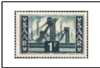
Puits de mine.