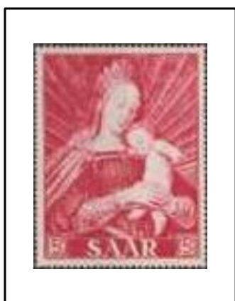
Madone du Maire Meyer de Bâle, par Hans Holbein le Jeune.