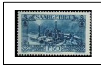
Aciéries de Burbach