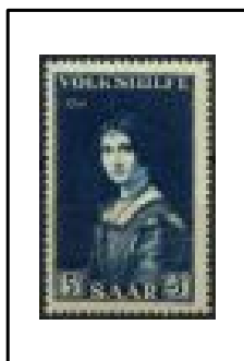
La belle Ferronnière. Par Léonard de Vinci.