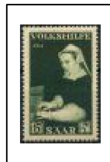
Dame jouant de l'épinette, par Frans Floris.