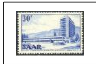
Bibliothèque de l'Université.