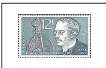
Centenaire de la naissance de Rudolf Diesel.