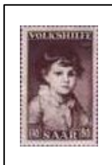
Le comte Stroganoff, enfant par Greuze.