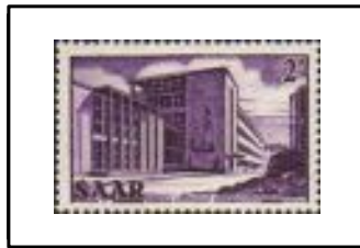
Lycée Ludwig, à Saarbruck.