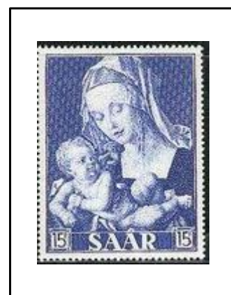
Madone et enfant tenant un trognon de poire, par Dürer.