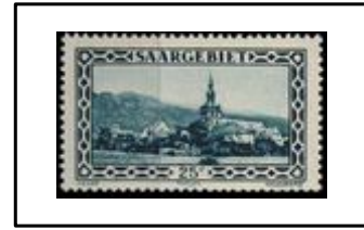
Village et abbaye de Tholey