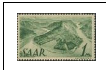
Boucle de la Sarre à Mettlach

1947. Timbre antérieurs avec valeur en surcharge.