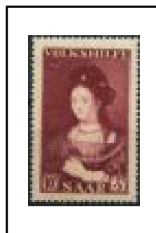
Portrait de Saskia, Par Rembrandt.