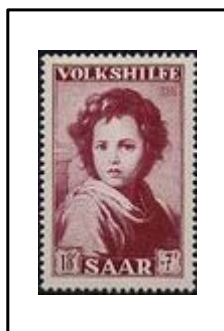
Le Berger divin, par Murillo