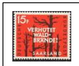
Pour la lutte contre les incendies de forêts.