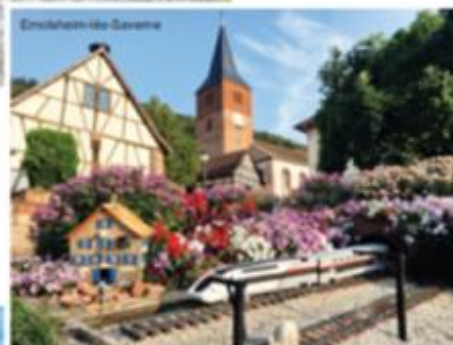
Ermlingen bei Saverny

Sobriquets et curiosités des communes d'Alsace